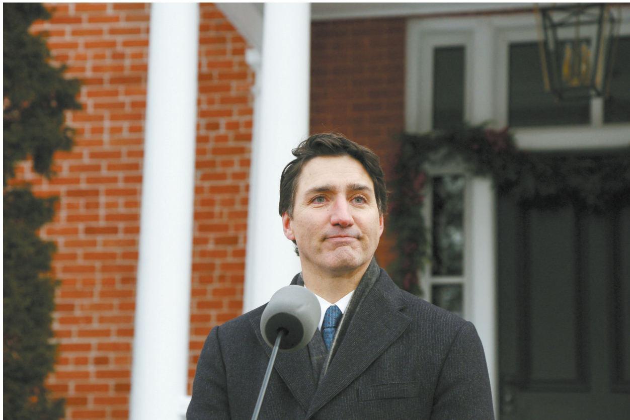
1月6日,加拿大总理特鲁多在渥太华向媒体发表讲话。

特鲁多政府在过去一年虽然作出一些努力回应批评,但未能挽回流失的民意。特鲁多在6日的演讲中说,他的辞职决定可以为党内斗争降温,议会休会和随后的自由党