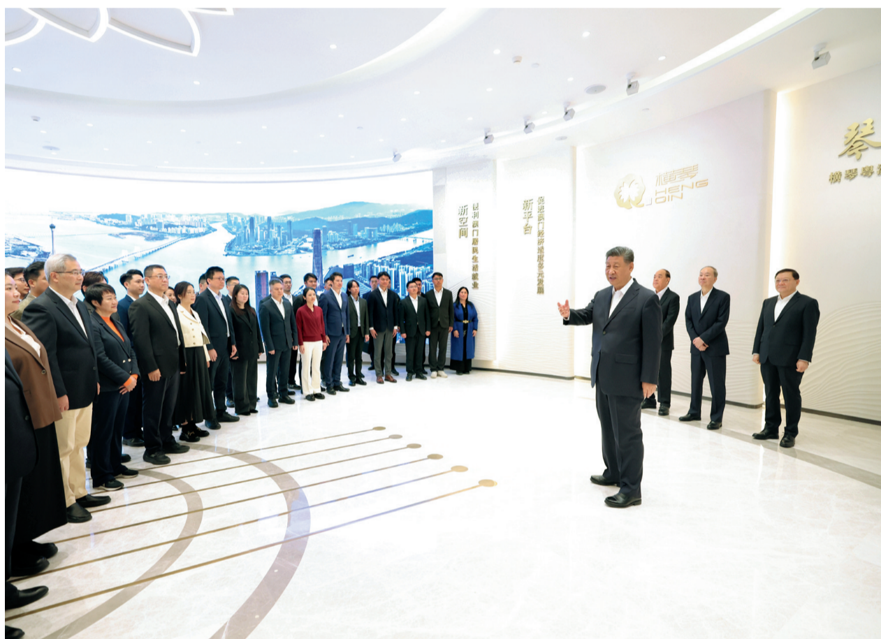
12月19日上午，中共中央总书记、国家主席、中央军委主席习近平在澳门特别行政区行政长官贺一诚陪同下，来到横琴粤澳深度合作区考察。这是习近平在横琴天沐琴台展示厅考察时，同参与横琴粤澳深度合作区规划、建设、管理、服务等各方面代表亲切交流。新华社记者 鞠鹏摄

新华社澳门12月19日电(记者朱基钗、杨依军、张研)19日上午，中共中央总书记、国家主席、中央军委主席习近平在澳门特别行政区行政长官贺一诚陪同下，来到横琴粤