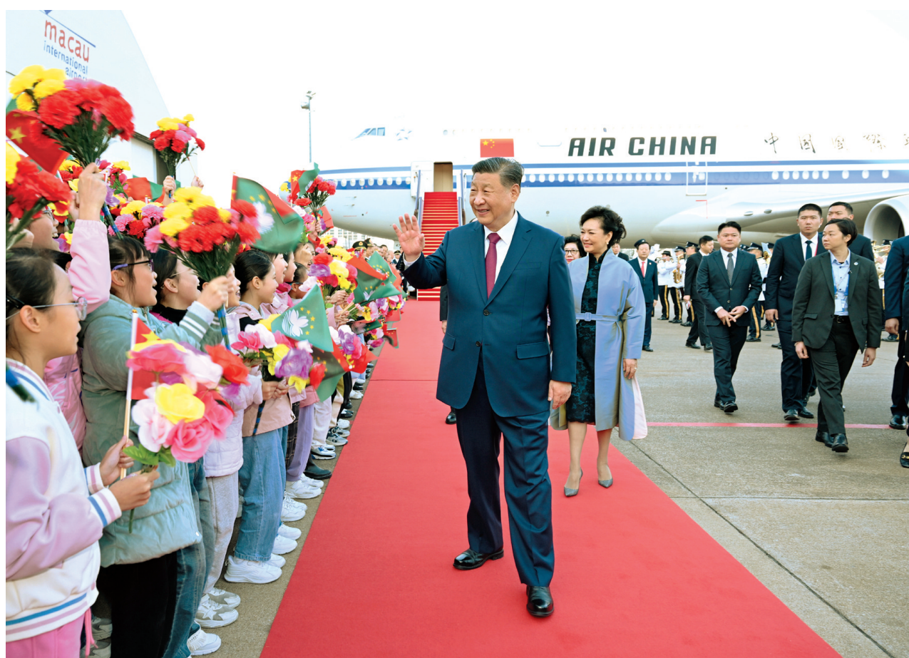
12月18日下午，中共中央总书记、国家主席、中央军委主席习近平乘专机抵达澳门，出席将于20日举行的庆祝澳门回归祖国25周年大会暨澳门特别行政区第六届政府就职典礼并视察澳门。这是习近平和夫人彭丽媛向欢迎人群致意。

新华社澳门12月18日电 中共中央总书记、国家主席、中央军委主席习近平18日下午乘专机抵达澳门，出席将于20日举行的庆祝澳门回归祖国25周年大会暨澳门特别行政区第六届政府就职典礼并视察澳门。