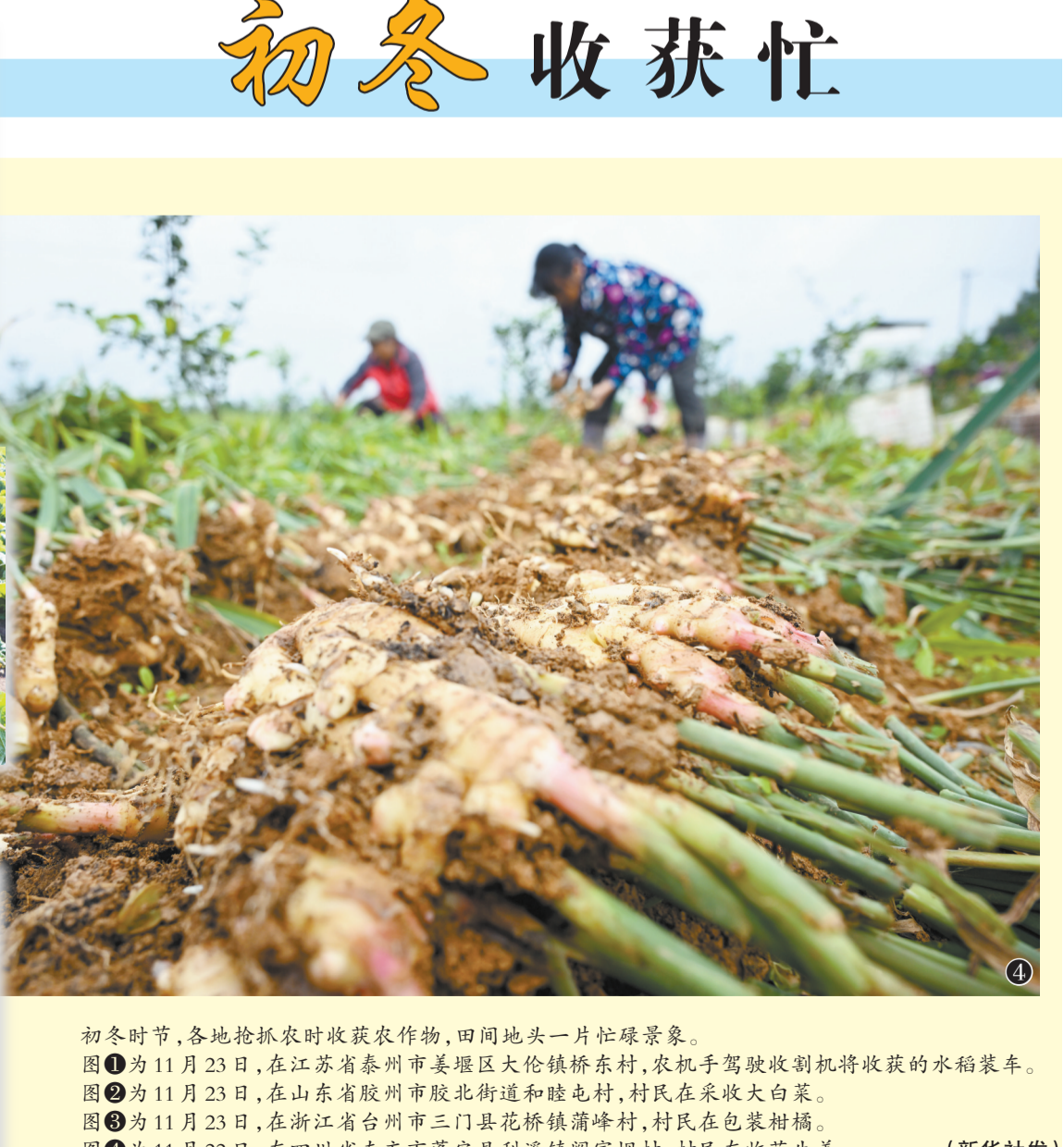
初冬时节,各地抢抓农时收获农作物,田间地头一片忙碌景象。