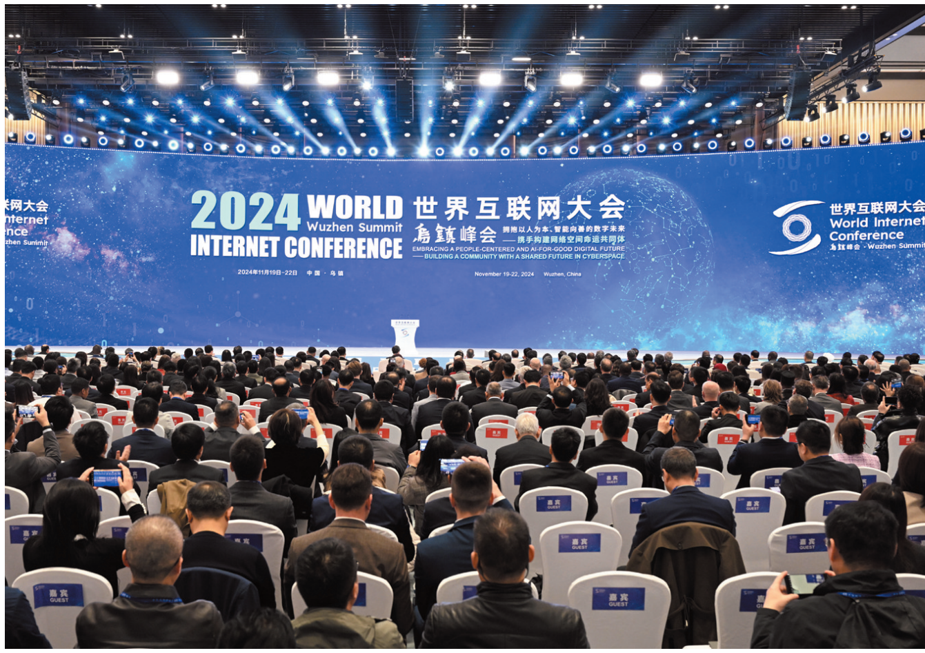
图为11月20日,2024年世界互联网大会乌镇峰会在浙江乌镇开幕。

新华社杭州11月20日电 2024年世界互联网大会乌镇峰会主论坛于11月20日在浙江乌镇举行。与会嘉宾表示,习近平主席向峰会视频致贺,鲜明提出加快推动网络空间创新发展、安全发展、普惠发展,携手迈进更加美好的“数字未来”,充分体现了对信息革命发展大势的深刻把握,对信息时代人类前途命运的深邃思考,为深化互联网领域国际交流合作、携手构建网络空间命运共同体提供了遵循。 与会嘉宾认为,要发挥互联网对现代化建设的重要驱动作用,主动顺应信息革命浪潮,大力推动人工智能、大数据、云计算、区块链等技术创新发展,加快科技成果向现实生产力转化。要倡导发展人工智能以增进人类共同福祉为目标,以保障社会安全、尊重人类权益为前提,符合全人类共同价值,促进以人为本、向善而行。要把互联网作为践行全球文明倡议的重要渠道,以信息化、智能化手段为各领域合作赋能,拓展网上文化交流互鉴。 主论坛期间举行了全球青年领军者计划入选者颁证仪式、世界互联网大会数字研修院启动仪式、世界互联网大会智库合作计划启动仪式等活动。重要国际组织负责人,中外政府部门、全球互联网领军企业代表,以及知名专家学者、媒体人士等1800余人现场参会。