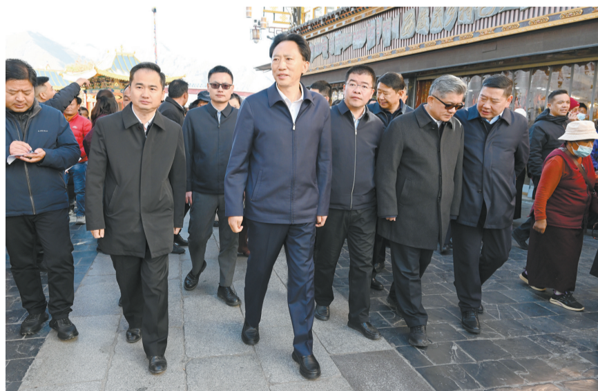
11月18日上午，自治区党委常委、拉萨市委书记肖友才前往八廓古城调研。这是肖友才在八廓古城了解古城保护与管理以及城乡环境综合大整治工作开展情况。