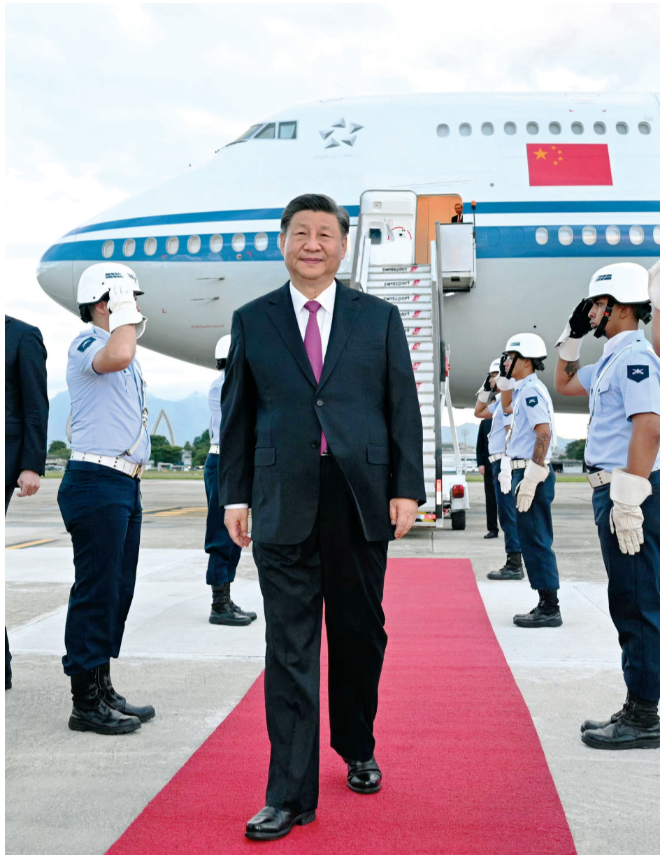
当地时间11月17日下午，国家主席习近平乘专机抵达里约热内卢，应巴西联邦共和国总统卢拉邀请，出席二十国集团领导人第十九次峰会并对巴西进行国事访问。

新华社里约热内卢11月17日电（记者陈威华、马峥）当地时间11月17日下午，国家主席习近平乘专机抵达里约热内卢，应巴西联邦共和国总统卢拉邀请，出席二十国集团领导人第十九次峰会并对巴西进行国事访问。