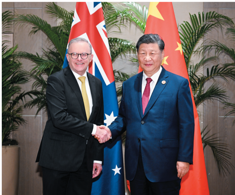
当地时间11月18日上午，国家主席习近平在里约热内卢出席二十国集团领导人峰会期间会见澳大利亚总理阿尔巴尼斯。

新华社里约热内卢11月18日电（记者朱超、吴昊）当地时间11月18日上午，国家主席习近平