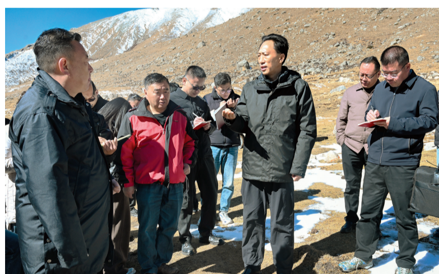
11月7日，自治区党委常委、拉萨市委书记肖友才深入墨竹工卡县实地调研指导抗震减灾工作。这是肖友才赶赴震源所在地日多乡拉龙村曲坚沟，调查核实灾情。

拉萨融媒讯（记者范江英）11月7日4时19分，拉萨市墨竹工卡县（北纬29.85度，东经92.25度）发生4.5级地震。7日一早，自治区党委常委、拉萨市委书记肖友才赶赴震源所在地日多乡拉龙村曲坚沟，调查核实灾情，看望慰问震源地区牧民群众，深入学校调研了解教学和生活秩序情况，并对下一步抗震减灾工作作出安排部署。强调，要深入学习贯彻党的二十届三中全会精神和习近平总书记关于防灾减灾救灾工作的重要讲话和重要指示批示精神，始终坚持人民至上、生命至上，抓实风险隐患排查、灾害预警等各项工