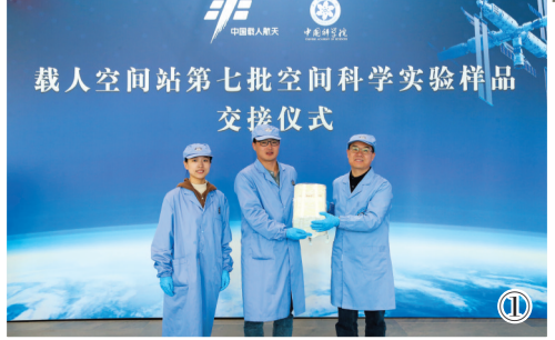
载人空间站第三批空间科学实验样品交接仪式