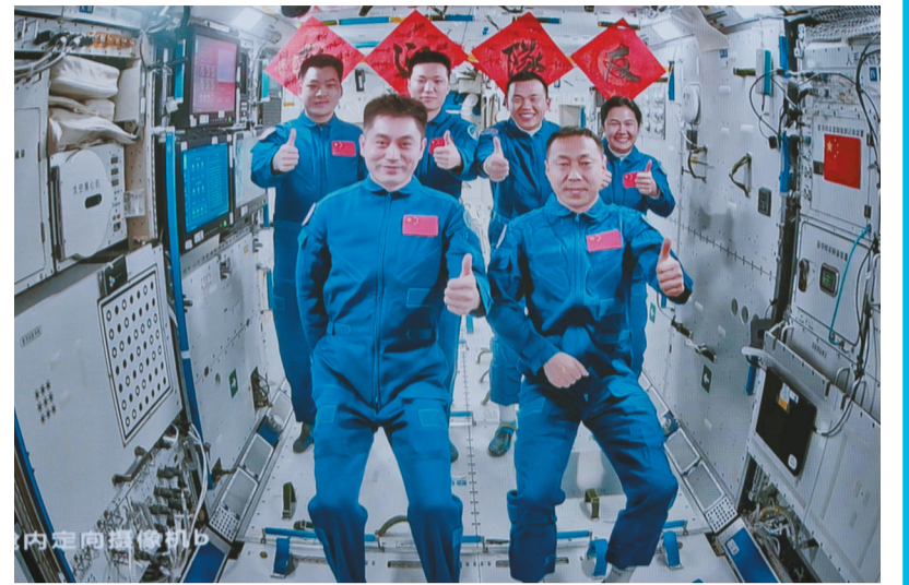
图为10月30日在北京航天飞行控制中心拍摄的神舟十九号航天员乘组和神舟十八号航天员乘组“全家福”。

第三，坚持社会参与、全民行动，建设老年友好型社会。积极应对人口老龄化，是全社会的共同责任。必须把积极老龄观、健康老龄化理念融入经济社会发展全过程，形成责任共担、人人参与的新局面。弘扬孝亲敬老传统美德，营造孝老尊老良好社会氛围，加强老年人权益保障。充分认识老年是仍然可以有作为、有进步、有快乐的人生重要阶段，制定完善促进老年人社会参与的政策措施，按照自愿、弹性原则，稳妥有序推进渐进式延迟法定退休年龄改革，创造适合老年人的多样化、个性化就业岗位。完善老年教育网络，丰富老年精神文化产品供给。推进适老化改造，深入开展“智慧助老”行动，支持城乡社区组织、社会组织为老年人提供更多便利，促进老年友好社区、老年友好城市建设。