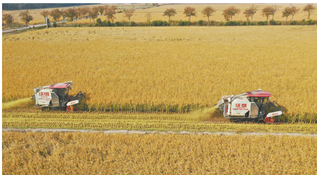
秋收时节，各地农民抢抓农时，田间田野一派丰收图景。这是10月30日，在江苏省宿迁市泗阳县城厢街道一家庭农场，农机手驾驶收割机收割水稻(无人机照片)。(新华社发)

(上接第一版)习近平总书记的重要讲话立意高远、思想深邃、论述精辟、内涵丰富，对于我们全面准确把握党的二十届三中全会精神，在新征程上推动改革行稳致远、推动各项改革举措精准落地见效，具有十分重要的意义。