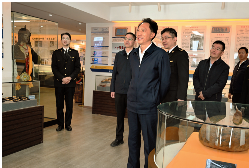
10月23日下午，自治区党委常委、拉萨市委书记肖友才到拉萨海关调研。这是肖友才在关史馆详细了解拉萨海关历史沿革情况。