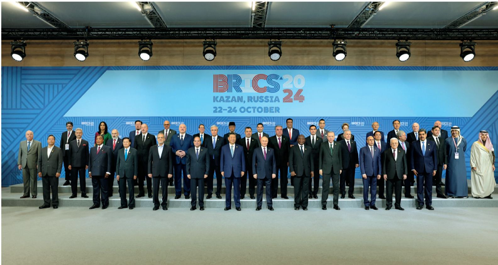
当地时间10月24日上午，国家主席习近平在喀山会展中心出席“金砖+”领导人对话会并发表题为《汇聚“全球南方”磅礴力量 共同推动构建人类命运共同体》的重要讲话。这是出席对话会的金砖国家及嘉宾国领导人或代表、国际组织负责人集体合影。

新华社俄罗斯喀山10月24日电（记者韩墨、刘恺）当地时间10月24日上午，国家主席习近平在喀山会展中心出席“金砖+”领导人对话会并发表题为《汇聚“全球南方”磅礴力量 共同推动构建人类命运共同体》的重要讲话。