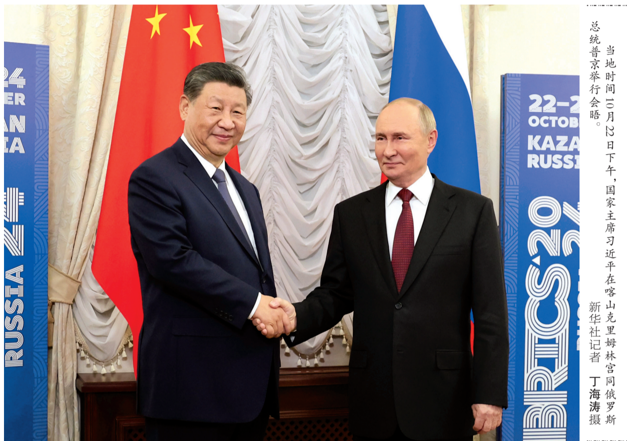
当地时间10月22日下午，国家主席习近平在阿斯塔纳克里姆林宫同俄罗斯总统普京举行会晤。

新华社俄罗斯阿斯塔纳10月22日电（记者郝薇、黄河）当地时间10月22日下午，国家主席习近平在阿斯塔纳克里姆林宫同俄罗斯总统普京举行会晤。 习近平指出，今年是中俄建交75周年。75年来，中俄关系风雨兼程，探索出“不结盟、不对抗、不针对第三方”的相邻大国正确相处之道。双方秉持永久睦邻友好、全面战略协作、互利合作共赢精神，不断深化和拓展全面战略协作和各领域务实合作，为推动两国发展振兴和现代化建设注入强劲动力，为增进中俄人民福祉、维护国际公平正义作出重要贡献。当前，世界正处于百年未有之大变局，国际形势变乱交织，但中俄世代友好的深厚情谊