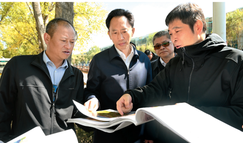
10月22日上午，自治区党委常委、拉萨市委书记肖友才实地调研拉萨河内河沿河两岸步行道提质改造工作。这是肖友才听取项目规划、查看设计图纸。

拉萨融媒讯（记者范江英）10月22日上午，自治区党委常委、拉萨市委书记肖友才实地调研拉萨河内河沿河两岸步行道提质改造工作。他强调，要聚焦城市发展所需、各族群众所盼，立足实际、科学规划，高效施工、精细管理，不断完善城市功能、提升城市品位，努力让各族群众真切感受到城市建设“看得见、摸得着”的幸福感。 市领导王强、李江新、张春阳、陆从福、洛色、高军参加。 沿着仙足岛北路、环岛东路、环岛北路，肖友才边走边看，现场指出沿线步道、景观绿化、设施配套等存在问题，当场解决难点堵点。指出，各有关部门要坚持全局观念和系统思维，进一步增强主动性、积极性、创造性，坚持用脚步丈量城市，扑下身子、沉到一线， （下转第四版）