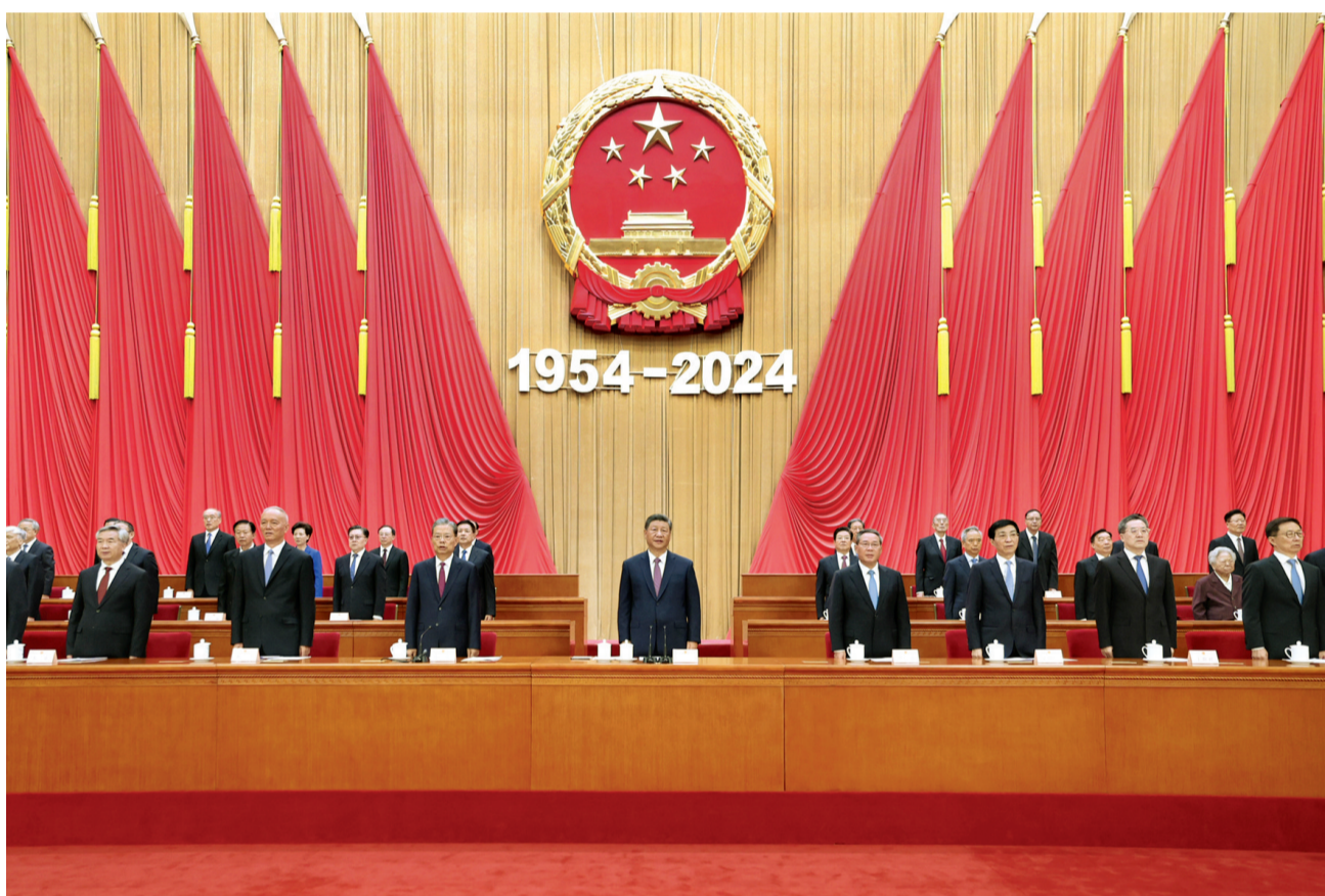
9月14日上午，中共中央、全国人大常委会在北京人民大会堂隆重举行庆祝全国人民代表大会成立70周年大会。习近平、李强、赵乐际、王沪宁、蔡奇、丁薛祥、李希、韩正等出席大会。新华社记者 鞠鹏摄

新华社北京9月14日电 中共中央、全国人大常委会14日上午在人民大会堂隆重举行庆祝全国人民代表大会成立70周年大会。中共中央总书记、国家主席、中央军委主席习近平出席会议并发表重要讲话。他强调，要进一步坚定道路自信、理论自信、制度自信、文化自信，发展全过程人民民主，坚持好、完善好、运行好人民代表大会制度，为实现新时代新征程党和人民的奋斗目标提供坚实制度保障。