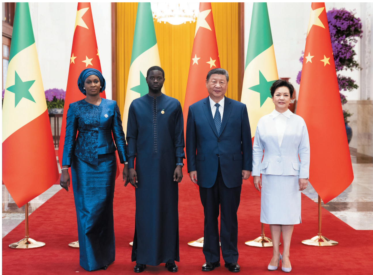
9月4日上午，国家主席习近平在北京人民大会堂同来华出席中非合作论坛北京峰会并进行国事访问的塞内加尔总统法耶举行会谈。会谈前，习近平在人民大会堂北大厅为法耶举行欢迎仪式。这是习近平和夫人彭丽媛同法耶和夫人玛丽合影。

新华社北京9月4日电(记者马卓言、王君璐)9月4日上午，国家主席习近平在北京人民大会堂同来华出席中非合作论坛北京峰会并进行国事访问的塞内加尔总统法耶举行会谈。