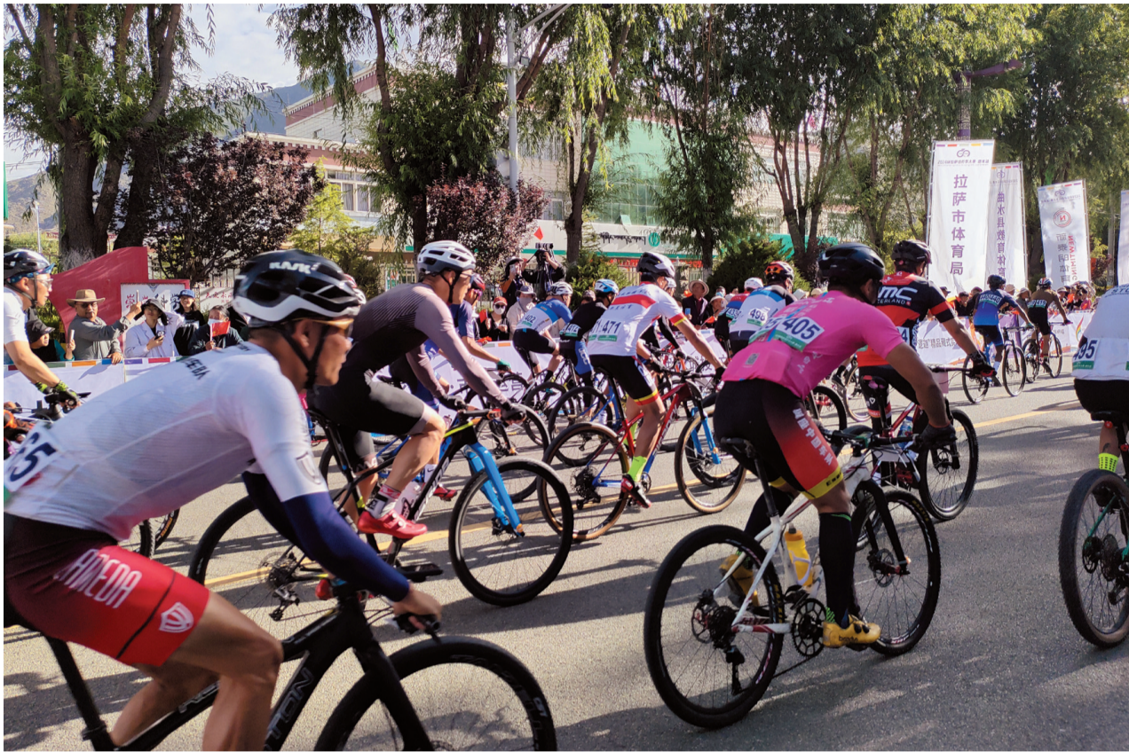
图为选手们在比赛中。

“我们医院负责2024环拉萨自行车大赛曲水站的57.5公里的医疗保障，我们全程设了三台随行车，三个救护点保证运动员安全。”