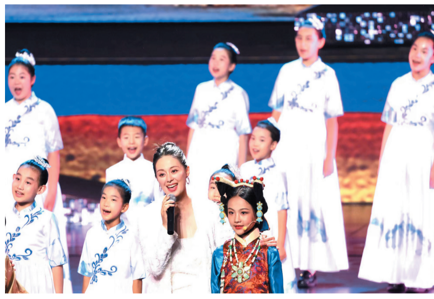
图为演出活动现场，小朋友为节目《原来拉萨》伴舞。

2024年是北京对口援藏30周年。30年来，京大地和雪域高原手相牵，北京援藏工作按照党中央和京拉两地市委、市政府的部署要求，在各民族交往交流交融、服务保障民生、推动拉萨市经济社会发展等方面付出了不懈努力，取得了卓越的成绩。北京市一批又一批援藏干部人才响应党中央号召，踏上西藏这片热土，把拉萨当作第二故乡，把党中央的关怀、北京