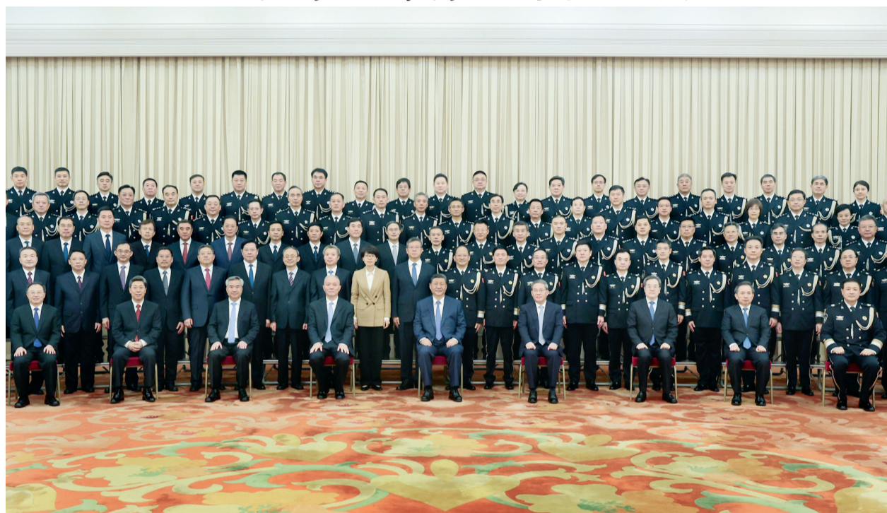
5月28日，党和国家领导人习近平、李强、蔡奇、丁薛祥、李希等在北京人民大会堂会见全国公安工作会议代表。