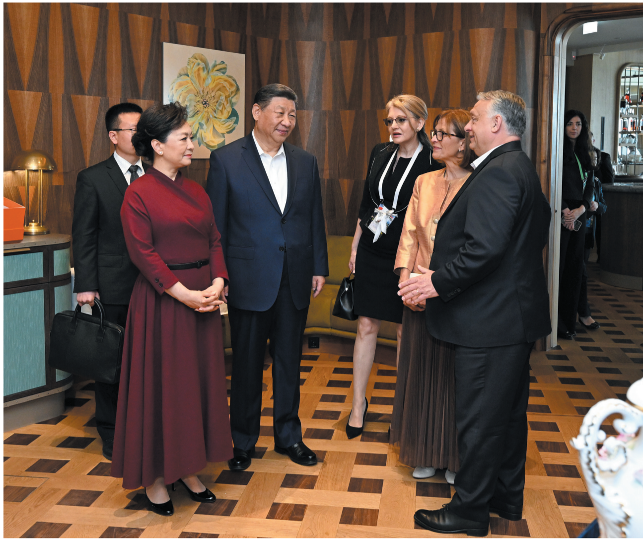
当地时间5月10日中午，国家主席习近平和夫人彭丽媛在布达佩斯应邀出席匈牙利总理欧尔班和夫人举行的饯行活动。

新华社布达佩斯5月10日电（记者淡然、张兆卿）当地时间5月10日中午，国家主席习近平和夫人彭丽媛在布达佩斯应邀出席匈牙利总理欧尔班和夫人举行的饯行活动。