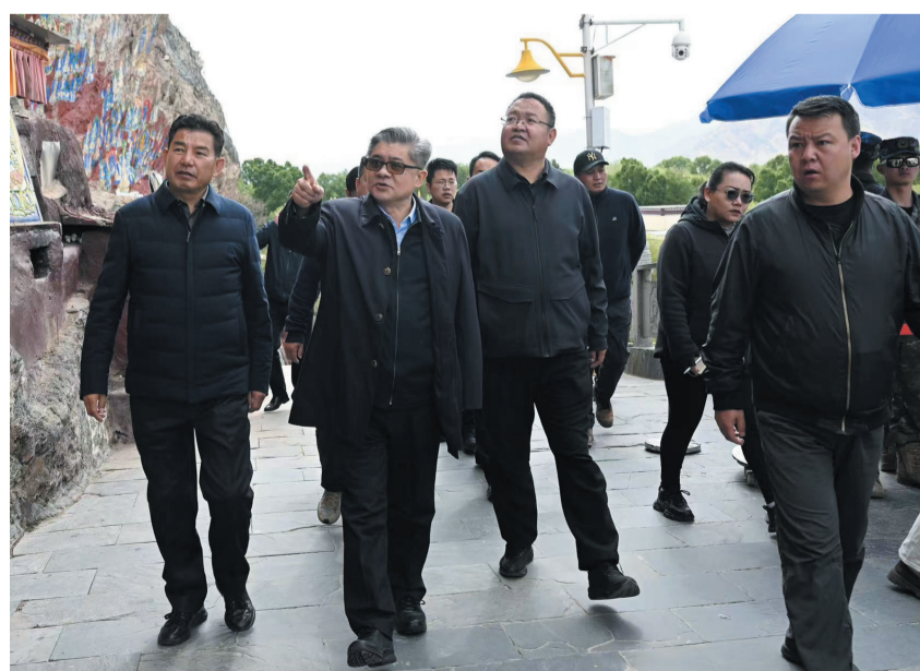
近日，市委副书记、市长王强在市区实地调研“萨嘎达瓦”期间我市维稳安保及服务管理工作落实情况。这是王强在药王山千佛崖实地了解各项维稳安保措施及便民服务落实情况。拉萨融媒记者 久美顿珠摄

调研中，王强一行边走边问、边听边看，先后前往药王山千佛崖和布达拉宫转经道等地，实地了解“萨嘎达瓦”期间各项维稳安保措施及便民服务落实情况，亲切慰问坚守维稳一线的各级各方力量。他强调，维护社会稳定责任重大，使命光荣，要敢于担当、主动作为。持续扎实开展维稳安保、安全检查、服务管理工作，依法维护正常宗教活动秩序，增强人民群众的获得感、幸福感、安全感。要总结经验，主动创新。对转经路线、重点路口科学调配力量。（下转第三版）