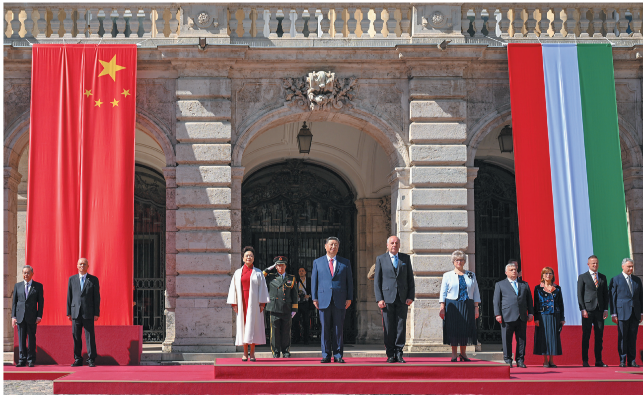
当地时间5月9日上午，国家主席习近平在布达佩斯出席匈牙利总统舒尤克和总理欧尔班共同举行的隆重欢迎仪式。