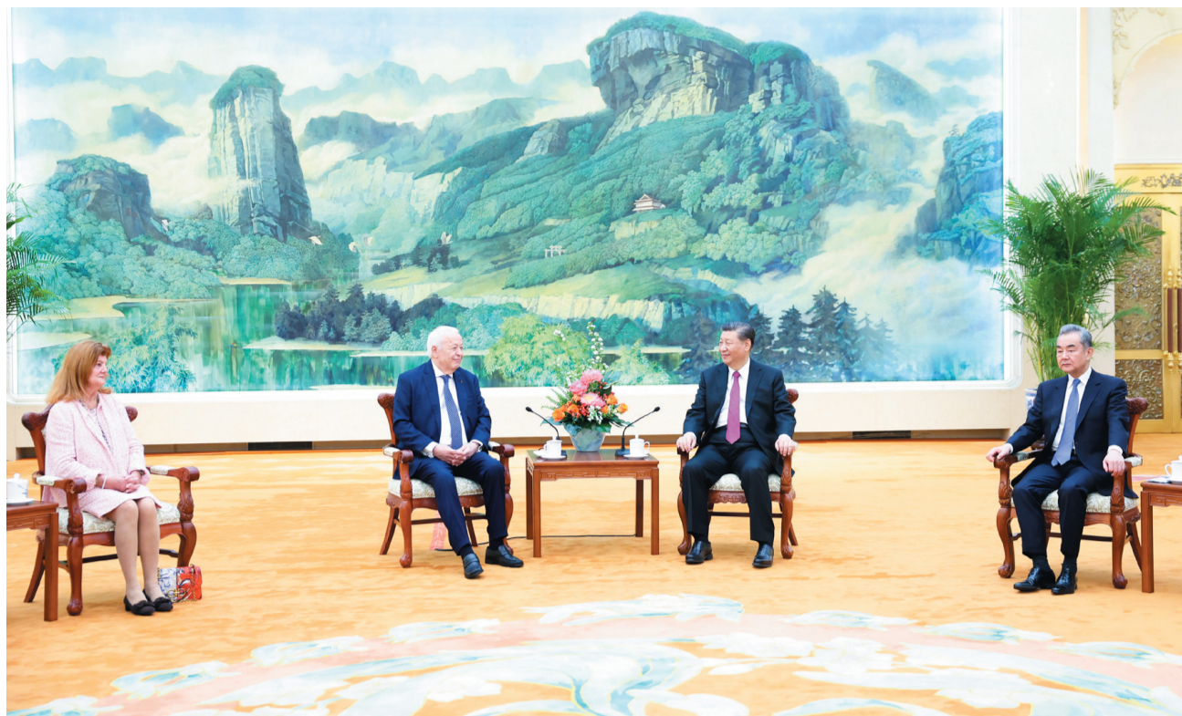
4月8日，国家主席习近平在北京人民大会堂会见法国梅里埃基金会主席梅里埃夫妇。