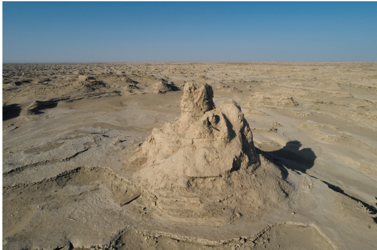
▲这是楼兰古城遗址(无人机照片,2018年9月21日摄)。