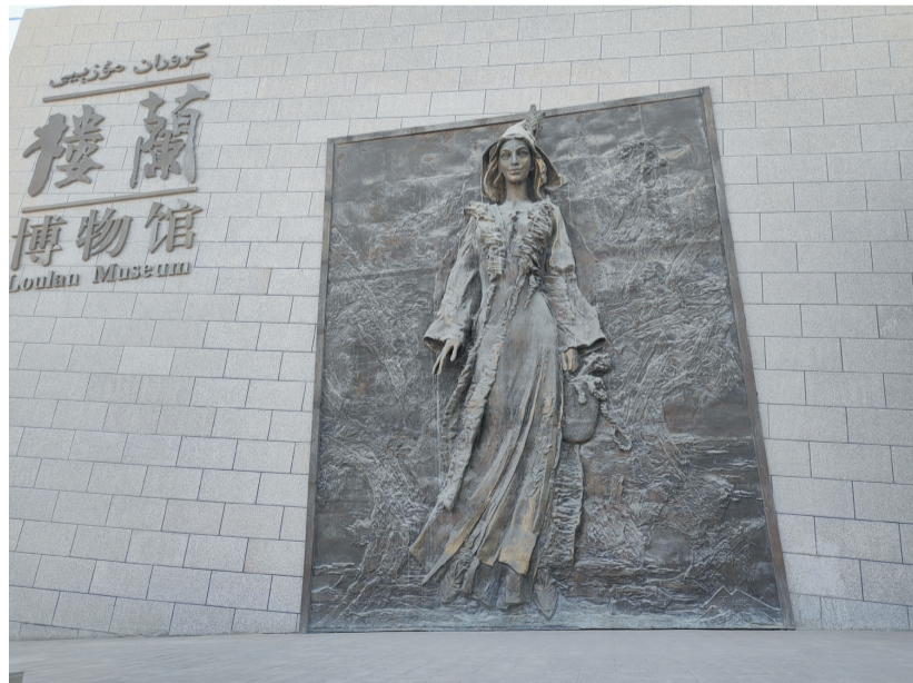
▲这是2023年11月9日拍摄的若羌县楼兰博物馆外景。