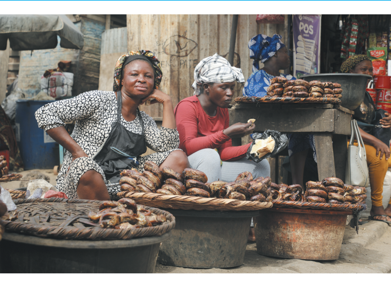
2月16日，商贩在尼日利亚拉各斯的一个市场售卖烟熏鱼。