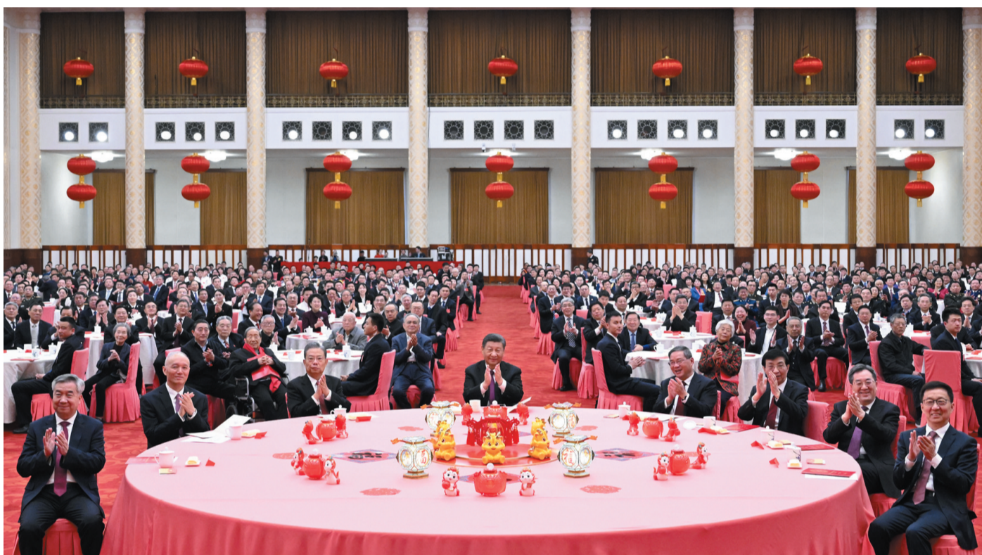
2月8日，中共中央、国务院在北京人民大会堂举行2024年春节团拜会。党和国家领导人习近平、李强、赵乐际、王沪宁、蔡奇、丁薛祥、李希、韩正等同首都各界人士齐聚一堂，共迎新春。

新华社北京2月8日电 中共中央、国务院8日上午在人民大会堂举行2024年春节团拜会。中共中央总书记、国家主席、中央军委主席习近平发表讲话，代表党中央和国务院，向全国各族人民，向香港特别行政区同胞、澳门特别行政区同胞、台湾同胞和海外侨胞拜年。