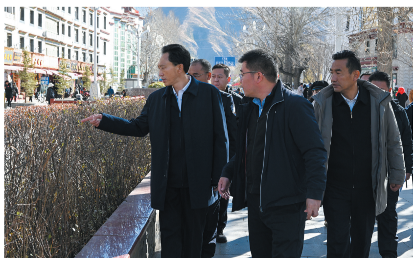
19日下午，自治区党委常委、市委书记肖友才调研道路交通整治行动开展情况。这是肖友才在康昂多路与北京路交叉口实地查看道路两侧绿化带。

拉萨融媒讯（记者央卓）19日下午，自治区党委常委、市委书记肖友才调研道路交通整治行动开展情况，听取相关情况汇报。他强调，要牢固树立以人民为中心的发展思想，结合正在开展的主题教育和城乡环境综合整治行动，多措并举、因地制宜，加快破解堵点痛点难点问题，努力让群众出行更顺畅、生活更舒畅。