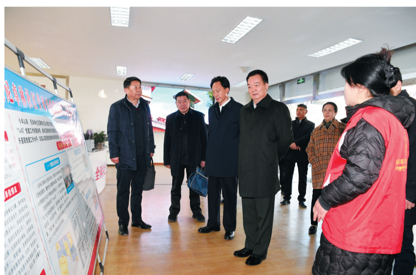
12月18日，自治区党委书记王君正深入拉萨市城关区社区、街道宣讲习近平新时代中国特色社会主义思想，调研拉萨市主题教育开展情况。这是王君正在扎曲街道尼卓林社区与基层干部、社工亲切交谈，现场调度基层网格员入户工作。

西藏日报 12月18日，自治区党委书记王君正深入拉萨市城关区社区、街道宣讲习近平新时代中国特色社会主义思想，调研拉萨市主题教育开展情况。他强调，要深入学习贯彻习近平总书记关于主题教育重要讲话精神，把实的要求贯穿主题教育全过程，充分发挥基层党组织引领作用，不断提升基层治理体系和治理能力现代化水平。