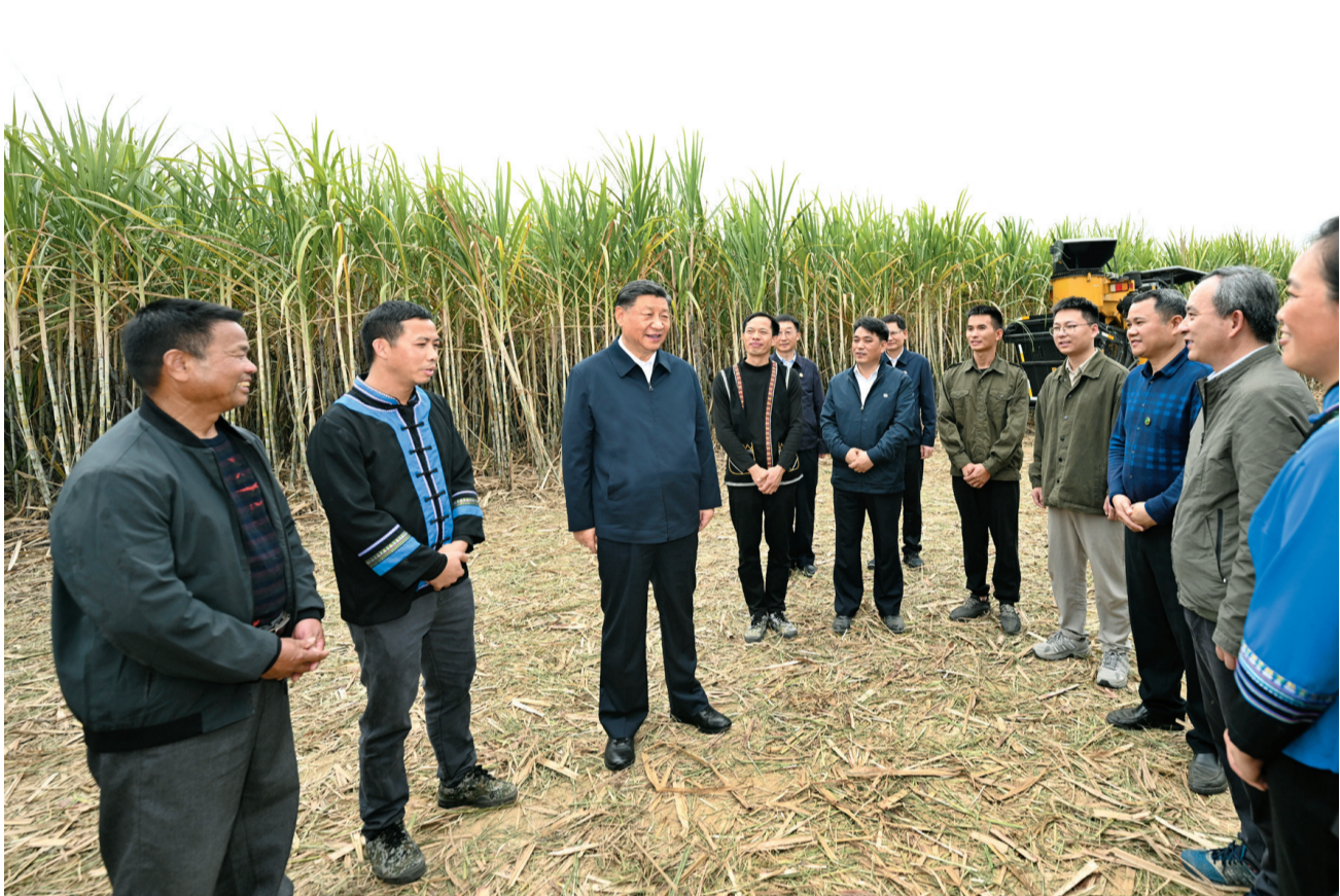
12月14日至15日，中共中央总书记、国家主席、中央军委主席习近平在广西考察。这是14日下午，习近平在来宾市国家现代农业产业园黄安优质“双高”糖料蔗基地考察时，同蔗农、农机手和农技人员亲切交流。