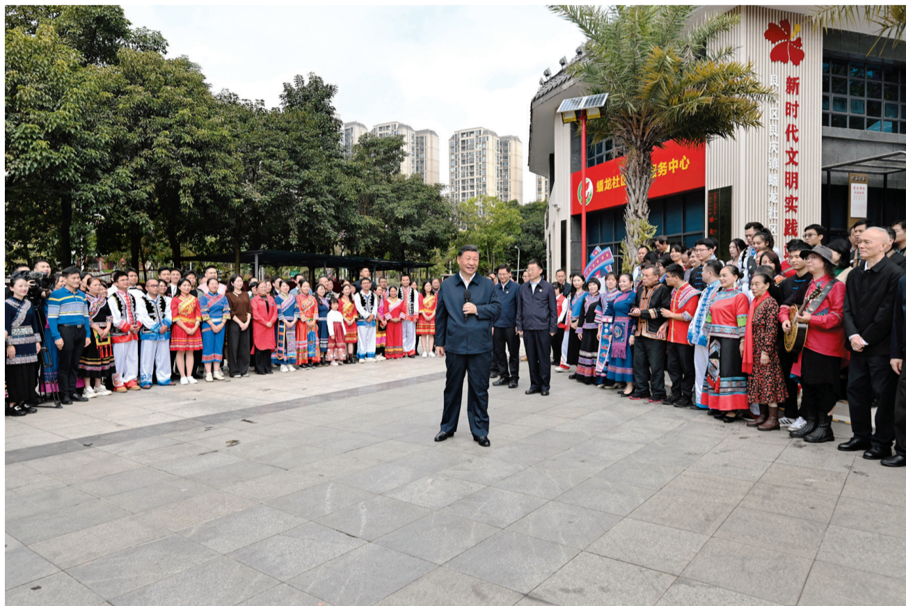
12月14日至15日，中共中央总书记、国家主席、中央军委主席习近平在广西考察。这是14日上午，习近平在南宁市良庆区蟠龙社区考察时，同社区各族群众亲切交流。