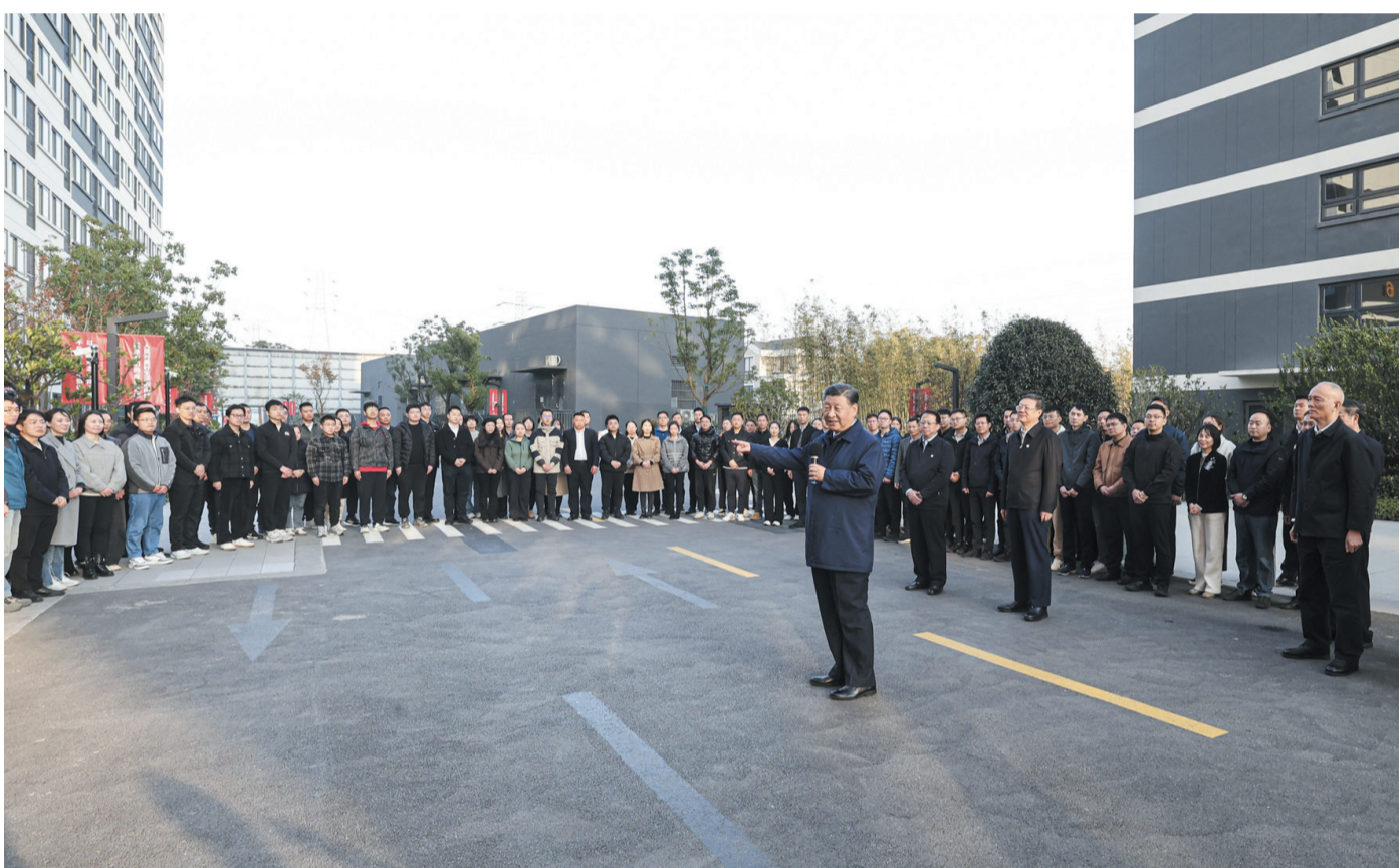
11月28日至12月2日，中共中央总书记、国家主席、中央军委主席习近平在上海考察。这是11月29日下午，习近平在闵行区新时代城市建设者管理者之家，同社区居民亲切交流。

新华社上海/江苏盐城12月3日电 中共中央总书记、国家主席、中央军委主席习近平近日在上海考察时强调，上海要完整、准确、全面贯彻新发展理念，围绕推动高质量发展、构建新发展格局，聚焦建设国际经济中心、金融中心、贸易中心、航运中心、科技创新